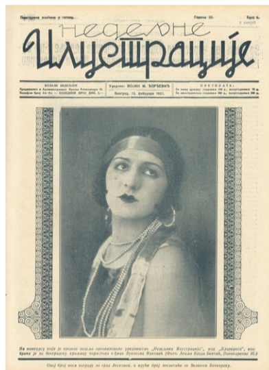
▲ „Nedeljne ilustracije“, 13. februar 1927.

Od oktobra 2021. Centar za američke studije u saradnji sa Narodnom bibliotekom Srbije i UDI-Euroclio, a uz podršku Američke ambasade u Beogradu, radi na projektu „Američka istorija u učionici: američki uticaji na popularnu kulturu i svakodnevnicu u Srbiji (1918-1941)“. Tokom trajanja projekta istraživači iz Centra za američke studije i Narodne biblioteke prelistavali su međuratnu štampu („Politika“, „Politikin zabavnik“, „Ilustrovani list“, „Ilustrovano vreme“, „Nedelja“, „Žena i svet“...) i istraživali fenomen amerikanizacije u Srbiji u međuratnom periodu. Ovaj projekat privodimo kraju u septembru objavljivanjem dodatnog nastavnog materijala za škole, kao i održavanjem seminara i vebinara za nastavnike istorije, građanskog vaspitanja i engleskog jezika. Dok je priručnik u pripremi, ovde možete pogledati neke od zanimljivosti koje su istraživači pronašli.