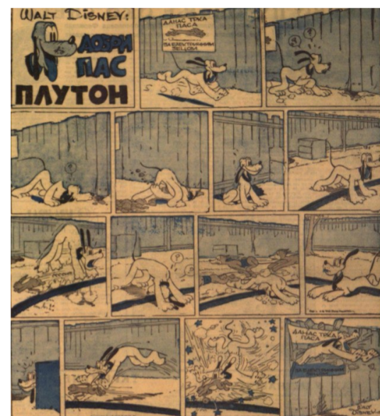
▲ „Politikin zabavnik“, april 1939.