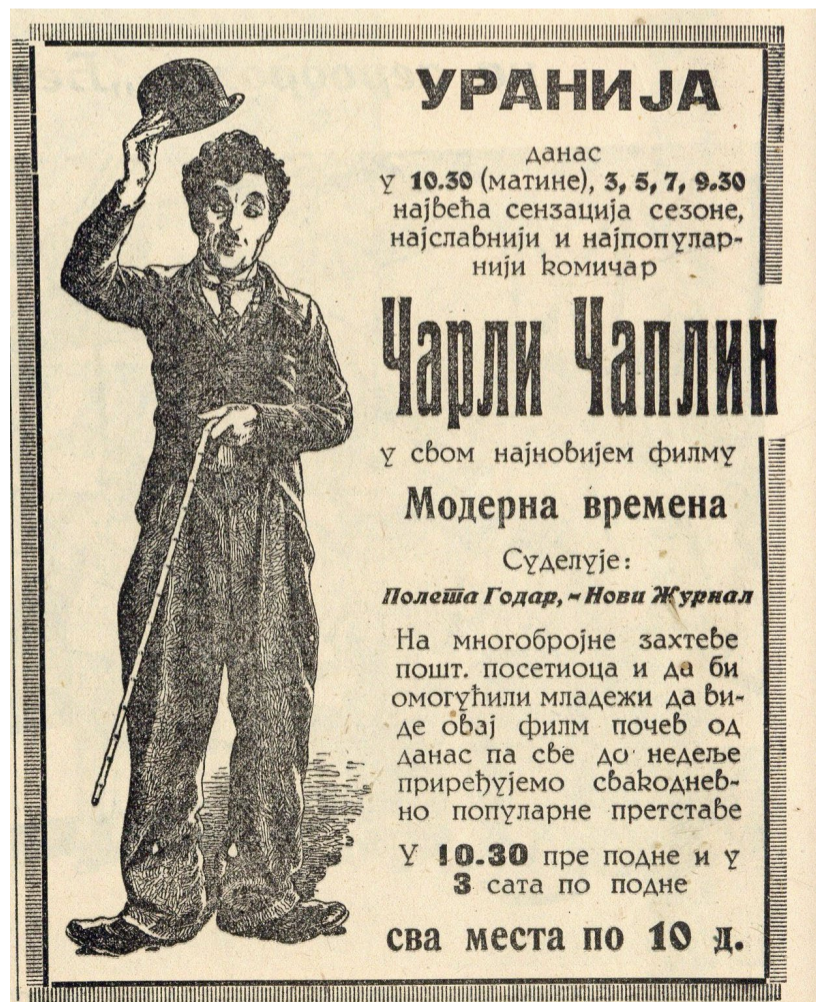
▲ „Vreme“, 15. april 1936.