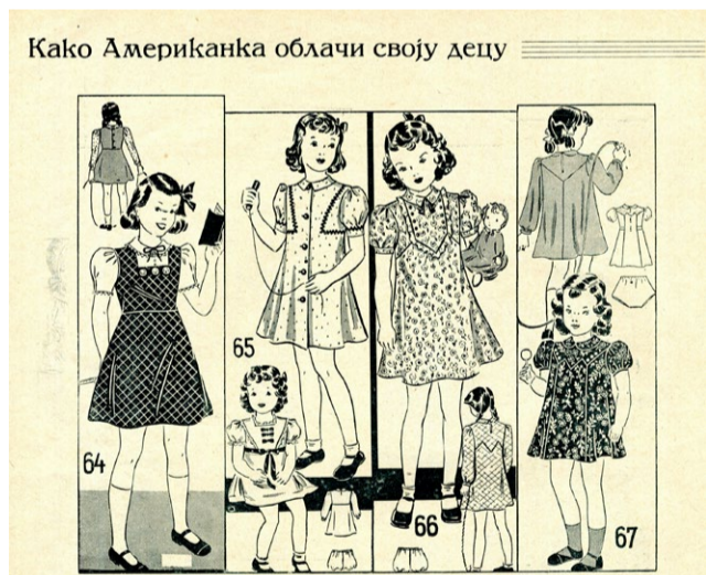
◀ „Žena i svet“, februar 1938.