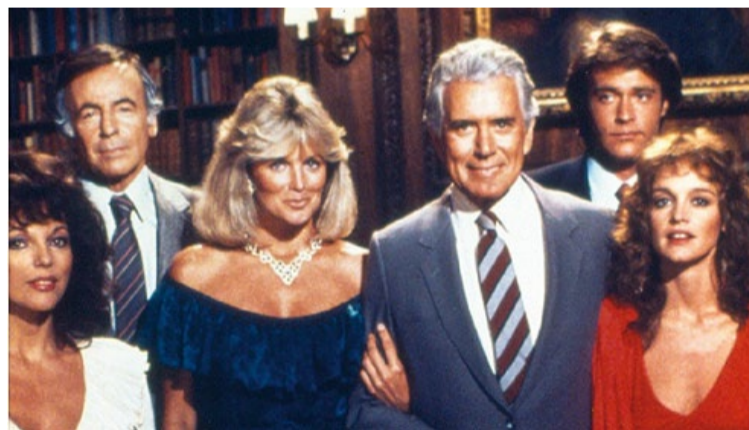
▲ Seriya „Dinastija“

Seriya puna zapleta kroz devet sezona prati živote bogate porodice Karington iz Denvera. Glavne uloge tumačili su Džon Forsajt (Blejk), Linda Evans (Kristal) i Džoana Kolins (Aleksis), a jugoslovenska štampa osamdesetih bila je preplavljena, kako komentariima i kritikama serije, tako i tekstovima koji su izveštavali čitaoce o aktuelnostima u životima glumaca. O popularnosti „Dinastije“ kod jugosloven-