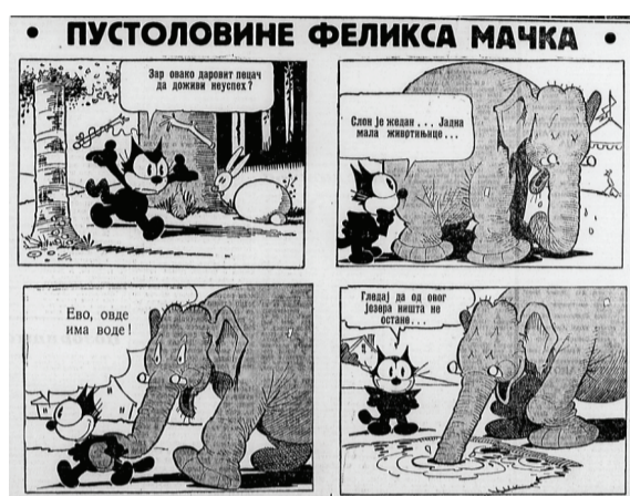
▲ „Pravda“, 12. decembar 1938.

broja, koji je izašao 28. februara 1939, postao je glavni časopis u kom su dominantno objavljivani američki stripovi i drugi slični sadržaji namenjeni prvenstveno deci, ali i odraslima. Novinar, publicista, umetnik i nadrealista Dušan Duda Timotijević bio je jedan od osnivača „Politikinog zabavnika“, prevodilac Diznijevih stripova na srpski i čovek koji je generalno zaslužan za pojavu stripa u Jugoslaviji.