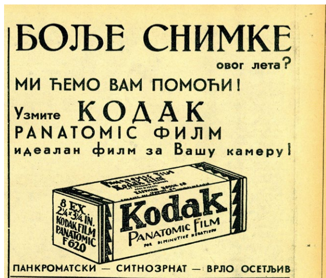
◀ „Panorama“, 6. jun 1932.