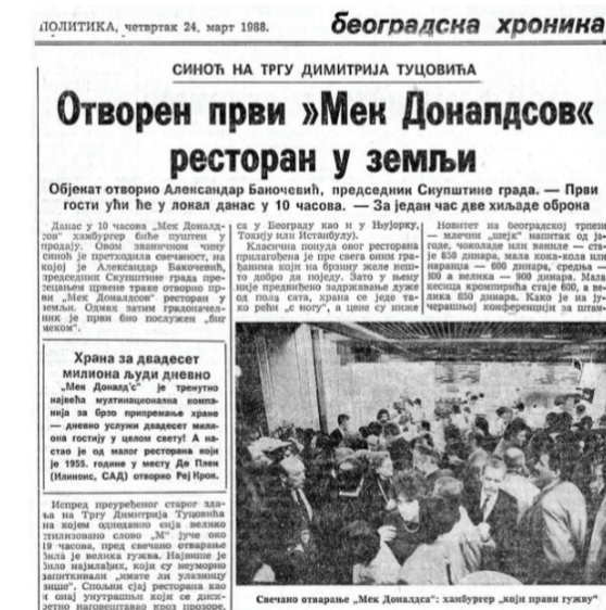
◀ „Politika“, 24. 3. 1988.

Prvi Mekdonalds u Jugoslaviji otvoren je u vreme ekonomske krize i pokušaja sprovođenja reformi. Nakon potpisivanja ugovora sa jugoslovenskim Generalexportom (Genexom), najpoznatiji lanac brze hrane otvorio je prvi restoran u Beogradu na Slaviji. Od 24. marta 1988. Beograđani su imali priliku da pojedu američki hamburger uz