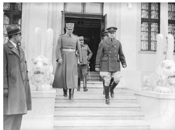
▲ General Mekartur, kapetan Dejvis, major Hazeltin i general Bodi 1931. u Beogradu